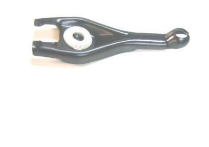
7004, HORQUILLA EMBRAGUE PEUGEOT 206-806-EXPERT-PARTNER NAFTERA, NEOTEK