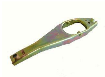
4022, HORQUILLA EMBRAGUE VW DODGE 1500, NEOTEK