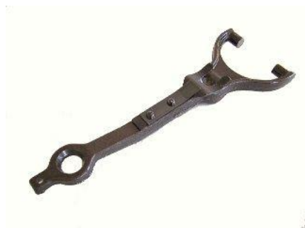
1218, HORQUILLA EMBRAGUE FORD F100-350-600-700-7000 MOTOR PERKINS, NEOTEK