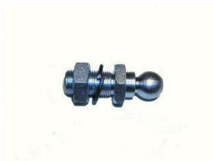
1079, ROTULA BALANCIN EMBRAGUE FORD F100-350-600 MOTOR PERKINS, NEOTEK