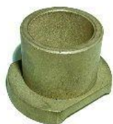
9040, BUJE HORQUILLA EMBRAGUE FIAT 128-DUNA-UNO-REGATTA, NEOTEK