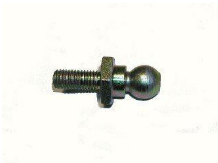
1076A, ROTULA BALANCIN EMBRAGUE FORD MOTOR PERKINS (ROSCA LARGA), NEOTEK