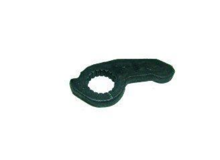
1215.1, LEVA DESEMBRAGUE FORD ESCORT 1.6-1.8 90/93, NEOTEK