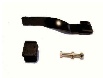
1444, BRAZO DESEMBRAGUE FORD ESCORT 1.6-1.8 DIESEL, NEOTEK