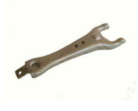
1223, HORQUILLA EMBRAGUE LADA LAIKA, NEOTEK