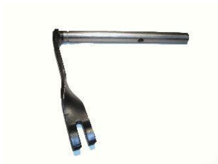
1215.2, BRAZO DESEMBRAGUE FORD ESCORT 1.6 88/92, NEOTEK