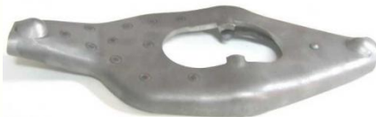
2067, HORQUILLA EMBRAGUE CHEVROLET S10-BLAZER, NEOTEK