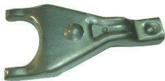
7002, HORQUILLA EMBRAGUE PEUGEOT 504-505 CAJA 4º 82/84 SIN CUBETA, NEOTEK