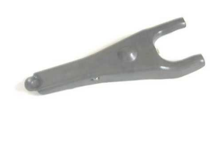
2068, HORQUILLA EMBRAGUE TOYOTA HILUX TODOS, NEOTEK