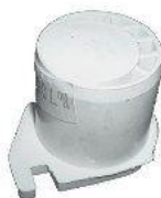
7003.2, BUJE INFERIOR HORQUILLA EMBRAGUE PEUGEOT 405 (ALTO), NEOTEK