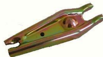
3077, HORQUILLA EMBRAGUE RENAULT TRAFIC 1400 CAJA 4º, NEOTEK