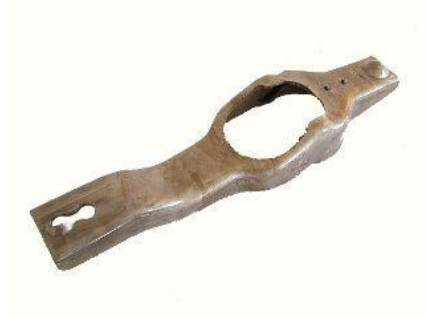
1210, HORQUILLA EMBRAGUE FORD TAUNUS, NEOTEK