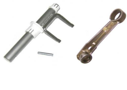
7009, HORQUILLA EMBRAGUE PEUGEOT 106-205, NEOTEK