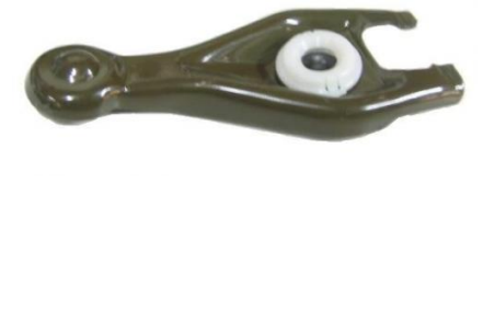
7005, HORQUILLA EMBRAGUE PEUGEOT 206 HIDRAULICO, NEOTEK