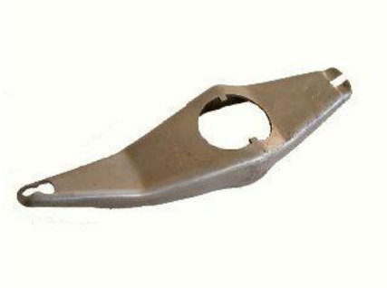
1214, HORQUILLA EMBRAGUE FORD SIERRA 2.3, NEOTEK