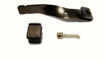
1442, BRAZO DESEMBRAGUE FORD FIESTA-ESCORT DIESEL, NEOTEK