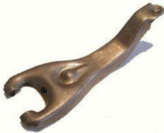
2053, HORQUILLA EMBRAGUE CHEVROLET CHEVY 70/77, NEOTEK