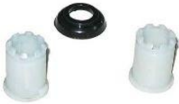
2072.1, BUJES EMBRAGUE (KIT) CHEVROLET CORSA, NEOTEK