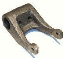
3098.1, HORQUILLA EMBRAGUE RENAULT 12 MOTOR 1400, NEOTEK