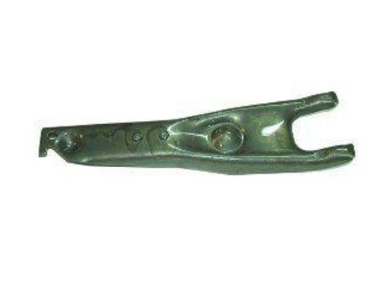
1212, HORQUILLA EMBRAGUE FORD FAIRLANE TODOS, NEOTEK