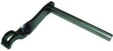
9015, EJE Y PALANCA DESEMBRAGUE FIAT DUNA 1.7 DIESEL, NEOTEK