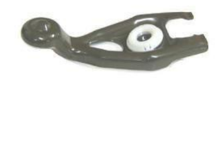
7006, HORQUILLA EMBRAGUE PEUGEOT 206-307, NEOTEK