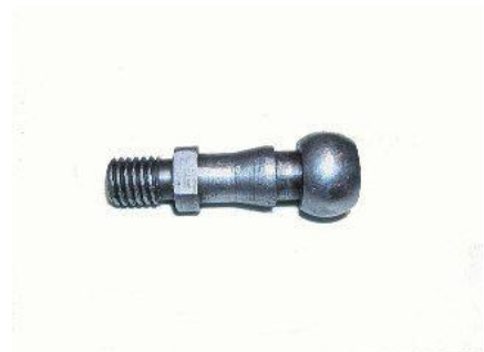
2035, ROTULA EMBRAGUE CHEVROLET 400-PICK UP L.MOTOR, NEOTEK