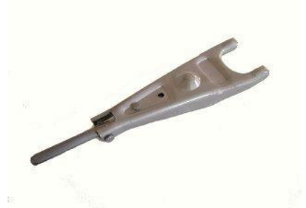
7000, HORQUILLA EMBRAGUE PEUGEOT 404-504 BA7 PERNO CORTO, NEOTEK