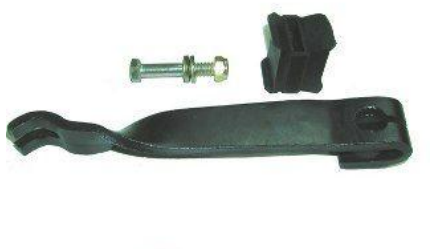
1443, BRAZO DESEMBRAGUE FORD FIESTA NAFTA, NEOTEK