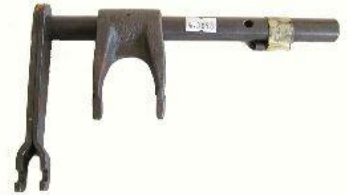
3098, CONJUNTO EJE CON HORQUILLA EMBRAGUE RENAULT 12 MOTOR 1400, NEOTEK