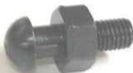
2041, BOLITA EMBRAGUE ISUZU LUV, NEOTEK