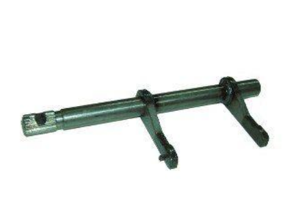
1441, HORQUILLA EMBRAGUE FORD FIESTA NAFTA-DIESEL, NEOTEK