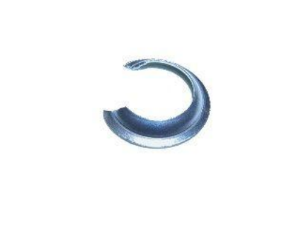
2047, RETEN BOLITA EMBRAGUE CHEVROLET TODOS 66/78, NEOTEK