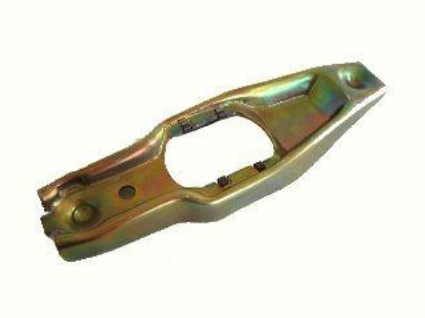
1215, HORQUILLA EMBRAGUE VW POLO-POINTER CAJA MQ, NEOTEK