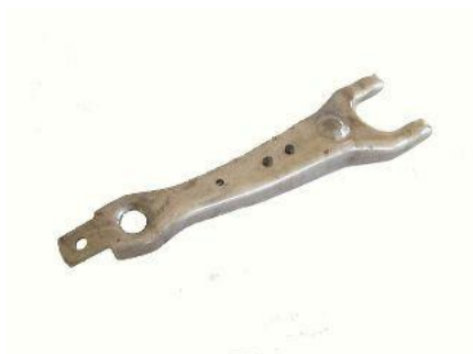
9013, HORQUILLA EMBRAGUE FIAT 1500, NEOTEK