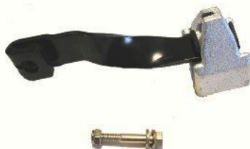
1444C, BRAZO DESEMBRAGUE C/CONTRAPESO FORD ESCORT 1.6-1.8 DIESEL, NEOTEK