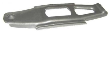
1222, HORQUILLA EMBRAGUE FORD F100 MOTOR MWM '99/F4000 MOTOR CUMMINS, NEOTEK