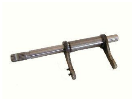
1550, HORQUILLA EMBRAGUE FORD ESCORT DIESEL '97 AD., NEOTEK