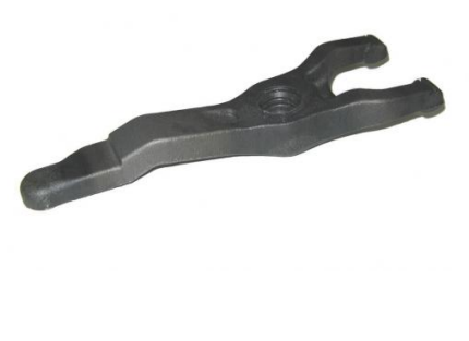
2139, HORQUILLA EMBRAGUE TOYOTA HILUX 3.0 2005 EN ADEL., NEOTEK