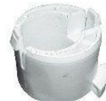
7003.1, BUJE SUPERIOR HORQUILLA EMBRAGUE PEUGEOT 405 (BAJO), NEOTEK