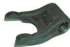
3091, HORQUILLA EMBRAGUE RENAULT 12-18 MOTOR 1600, NEOTEK