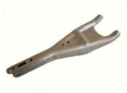
4025, HORQUILLA EMBRAGUE VW DODGE VALIANT-POLARA, NEOTEK