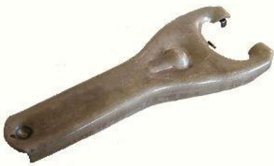
2052, HORQUILLA EMBRAGUE CHEVROLET 400 CORTA, NEOTEK