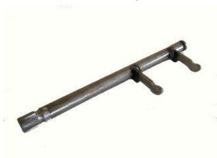
4026, HORQUILLA EMBRAGUE VW GACEL-CARAT (ESTRIADO LARGO), NEOTEK