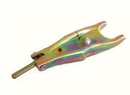
3072, HORQUILLA EMBRAGUE RENAULT TRAFIC NL5 NAFTA CAJA 5° CON PERNO, NEOTEK