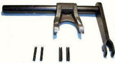
3093, CONJUNTO EJE CON HORQUILLA EMBRAGUE RENAULT 12 MOTOR 1600, NEOTEK