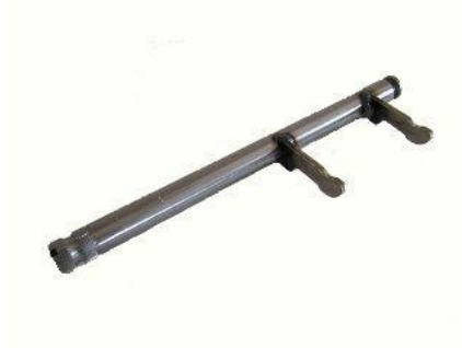
1135, HORQUILLA EMBRAGUE VW SENDA-SAVEIRO NAFTEROS, NEOTEK