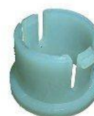
7010.2, BUJE HORQUILLA EMBRAGUE PEUGEOT 106-205 (CHICO), NEOTEK