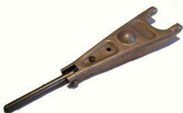
1209A, HORQUILLA EMBRAGUE RASTROJERO INDENOR PERNO LARGO, NEOTEK