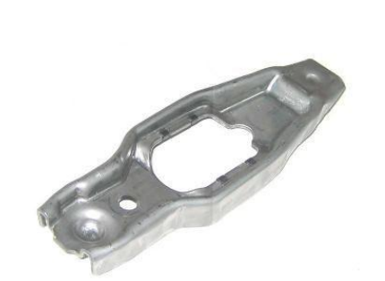
4021, HORQUILLA EMBRAGUE VW POLO HIDRAULICO N° ORIG.021141703, NEOTEK