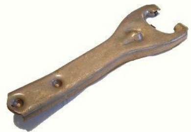
2051, HORQUILLA EMBRAGUE CHEVROLET PICK UP 66/77 LARGA, NEOTEK