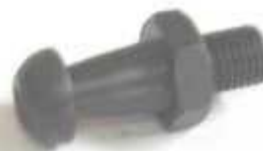
2040, BOLITA EMBRAGUE TOYOTA HILUX, NEOTEK