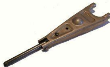
1209A, HORQUILLA EMBRAGUE PEUGEOT 504/2000 XD2 PERNO LARGO, NEOTEK