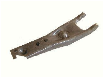
1211, HORQUILLA EMBRAGUE FORD FALCON-F100, NEOTEK