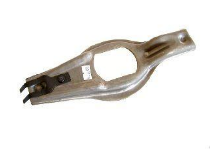
1600, HORQUILLA EMBRAGUE MERCEDES BENZ SPRINTER, NEOTEK