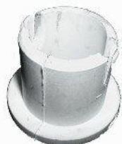
7010.1, BUJE HORQUILLA EMBRAGUE PEUGEOT 106-205 (GRANDE), NEOTEK