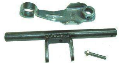
7003, CONJUNTO EMBRAGUE CON HORQUILLA PEUGEOT 405, NEOTEK