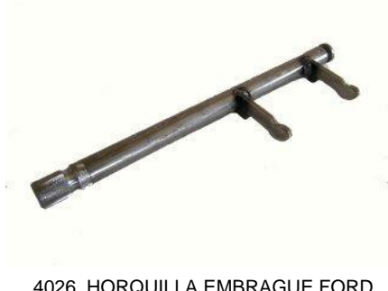
4026, HORQUILLA EMBRAGUE FORD GALAXI TODOS (ESTRIADO LARGO), NEOTEK