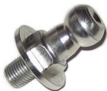
2133, ROTULA EMBRAGUE TOYOTA HILUX, NEOTEK