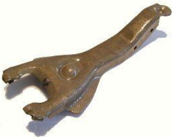
2055, HORQUILLA EMBRAGUE CHEVROLET PICK UP C10 SEVEL, NEOTEK