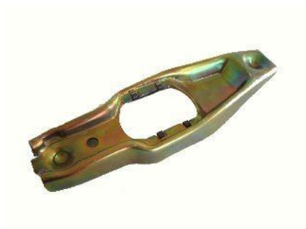
1215, HORQUILLA EMBRAGUE FORD ESCORT-ORION CAJA MQ, NEOTEK