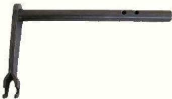
3092, EJE CON HORQUILLA EMBRAGUE RENAULT 12 MOTOR 1600, NEOTEK