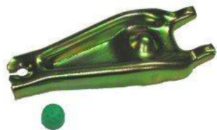
3038, HORQUILLA EMBRAGUE RENAULT 9-11 (SIN FLEJE), NEOTEK