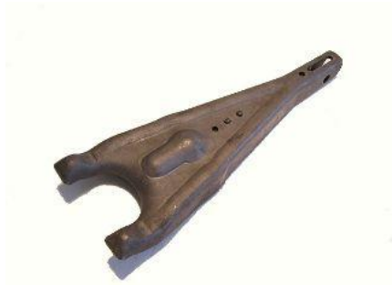
4023, HORQUILLA EMBRAGUE VW DODGE D100-200-400-500, NEOTEK