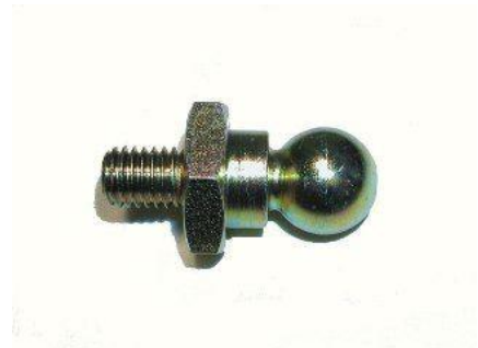
1076, ROTULA BALANCIN EMBRAGUE FORD MOTOR PERKINS, NEOTEK