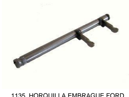
1135, HORQUILLA EMBRAGUE FORD GALAXI TODOS (ESTRIADO CORTO), NEOTEK