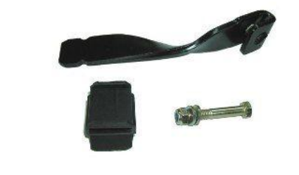
1449, BRAZO DESEMBRAGUE FORD FIESTA-ESCORT DIESEL, NEOTEK