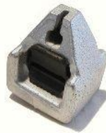
1442.2, CONTRAPESO BRAZO DESEMBRAGUE FORD FIESTA-ESCORT, NEOTEK