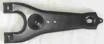
2140, HORQUILLA EMBRAGUE CHEVROLET LUV, NEOTEK