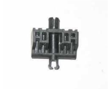
1222.1, PERNO MUÑON PARA HORQUILLA 1222, NEOTEK