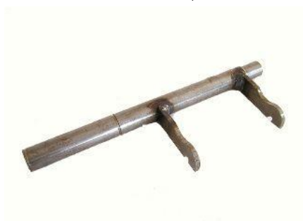
4024, HORQUILLA EMBRAGUE VW KOMBI, NEOTEK