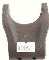
3099.1, HORQUILLA EMBRAGUE RENAULT 18-TRAFIC MOTOR 1400, NEOTEK