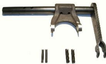
3099, CONJUNTO EJE CON HORQUILLA EMBRAGUE RENAULT 18-TRAFIC MOTOR 1400, NEOTEK