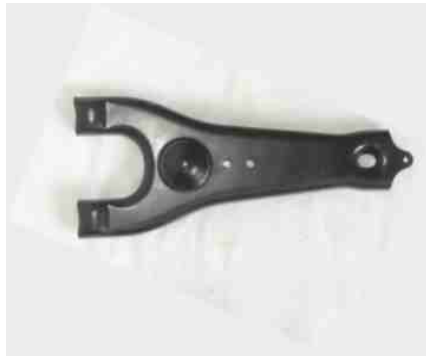
2140, HORQUILLA EMBRAGUE ISUZU LUV, NEOTEK