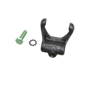
2141, HORQUILLA EMBRAGUE FORJADA CHEVROLET CORSA TODOS, NEOTEK