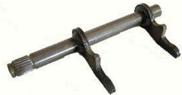
9011, EJE CON HORQUILLA EMBRAGUE FIATUNO-DUNA-REGATTA-FIORINO, NEOTEK