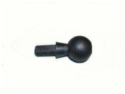
2046, ROTULA EMBRAGUE CHEVROLET 400-PICK UP L CHASIS, NEOTEK