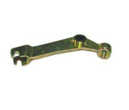
7011C, LEVA REENVIO EMBRAGUE PEUGEOT 504 CON BUJE, NEOTEK