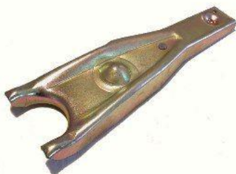
3071, HORQUILLA EMBRAGUE RENAULT 18, NEOTEK