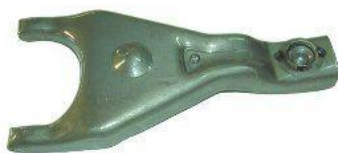
7001, HORQUILLA EMBRAGUE PEUGEOT 504-505 CAJA 5º 85 AD.CON CUBETA, NEOTEK