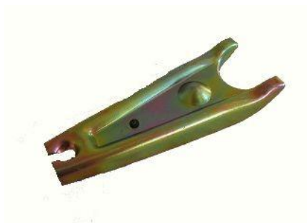
3078, HORQUILLA EMBRAGUE RENAULT TRAFIC A CABLE 93/AD. CAJA 5°, NEOTEK