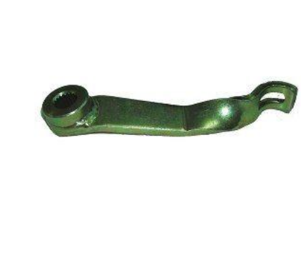
9010, PALANCA DESEMBRAGUE FIAT UNO-DUNA-REGATTA-FIORINO, NEOTEK