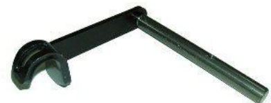
9014, EJE Y PALANCA DESEMBRAGUE FIAT 128-147-DUNA-UNO-REGATTA, NEOTEK