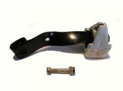
1449C, BRAZO DESEMBRAGUE C/CONTRAPESO FORD FIESTA-ESCORT DIESEL, NEOTEK