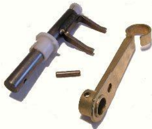
7010, CONJUNTO HORQUILLA EMBRAGUE PEUGEOT 106-205 (COMPLETO), NEOTEK