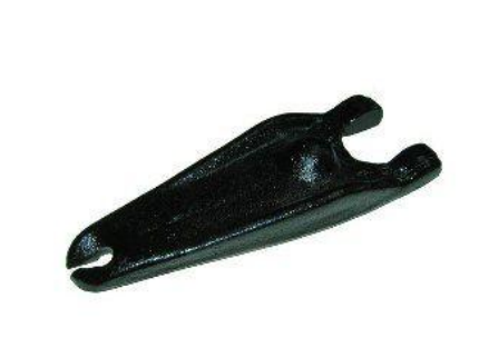
3083, HORQUILLA EMBRAGUE RENAULT TRAFIC DIESEL MOTOR F8Q, NEOTEK