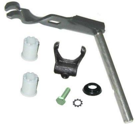
2072C, HORQUILLA EMBRAGUE CHEVROLET CORSA COMPLETA, NEOTEK