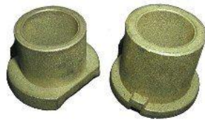
9043, BUJES HORQUILLA EMBRAGUE (KIT) FIAT 128-DUNA-REGATTA, NEOTEK