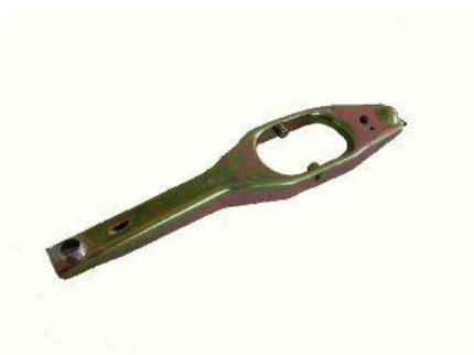
9012, HORQUILLA EMBRAGUE FIAT 125-1600, NEOTEK