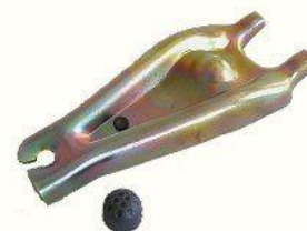
3039, HORQUILLA EMBRAGUE RENAULT 9-11 (CON FLEJE), NEOTEK