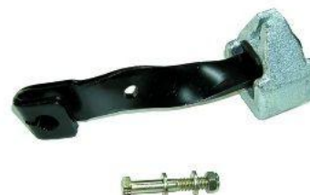
1442C, BRAZO DESEMBRAGUE C/CONTRAPESO FORD FIESTA-ESCORT DIESEL, NEOTEK