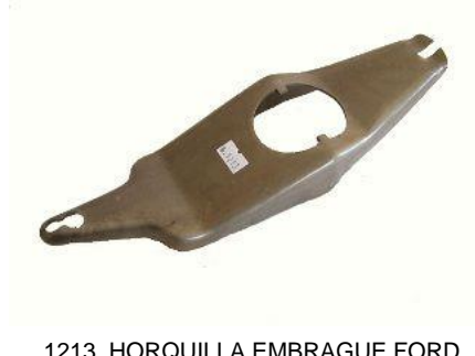
1213, HORQUILLA EMBRAGUE FORD SIERRA 1.6, NEOTEK