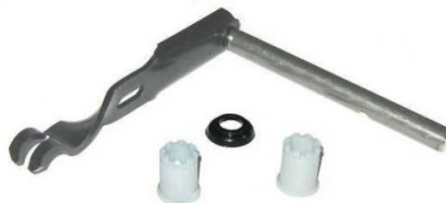
2072, EJE EMBRAGUE (KIT) CHEVROLET CORSA, NEOTEK