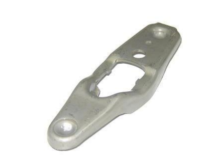
4054, HORQUILLA EMBRAGUE VW FOX, NEOTEK