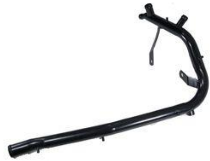
1053, CAÑO CIRCULACION AGUA VW TRANSPORTER 2.4 DIESEL, DINAHCOM