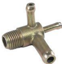
8303, CAÑO AGUA MULTIPLE ADMISION FIAT DUNA-UNO 1.6, DINAHCOM