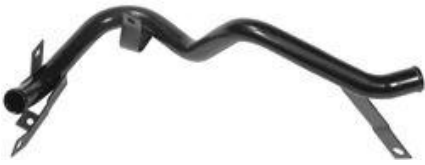
4004, CAÑO CIRCULACION AGUA PEUGEOT 306-405 1.9 DIESEL, DINAHCOM