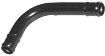
807, CONECTOR AGUA CODO VW GOLF 1.8 MEXICO, DINAHCOM