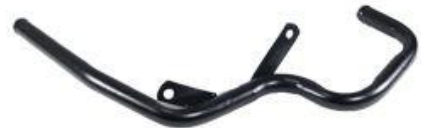
1335, CAÑO CIRCULACION AGUA FORD FOCUS TURBO DIESEL, DINAHCOM