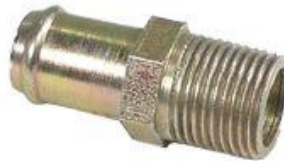
625, CONECTOR BOMBA AGUA FORD FALCON, DINAHCOM