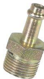
8320, CAÑO TAPA CILINDRO FIAT 147-SPAZIO, DINAHCOM