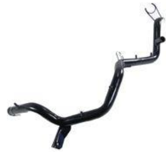
4158, CAÑO CIRCULACION AGUA VW GOLF 2.0 95/AD.-POLO DIESEL 96/AD. (SIN SOPORTE), DINAHCOM