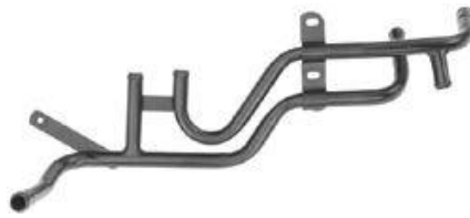
4350, CAÑO CIRCULACION AGUA VW GOL AB9-SAVEIRO 1.9 DIESEL C/A.A., DINAHCOM