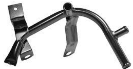
4351, CAÑO CIRCULACION AGUA VW GOL III 1.9 DIESEL 98-SAVEIRO 00/, DINAHCOM