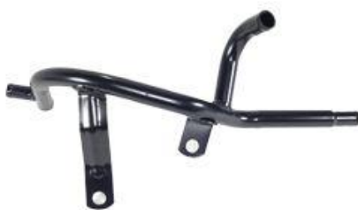
4154, CAÑO CIRCULACION AGUA VW QUANTUM 93/AD., DINAHCOM