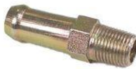
630, CAÑO PARA BOMBA AGUA RENAULT 12 (CHICO), DINAHCOM