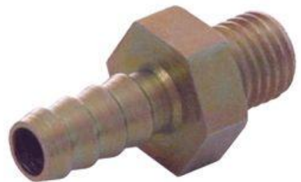
618, CONECTOR AGUA MULTIPLE ADMISION FORD ESCORT-FIESTA-MONDEO, DINAHCOM