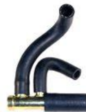
808KIT, CAÑO CIRCULACION AGUA VW POLO-GOLF-CADDY 1.9 '96 AD.(CONJUNTO), DINAHCOM