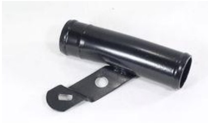
3135, CAÑO CIRCULACION AGUA RENAULT 19 RL-RT DIESEL, DINAHCOM