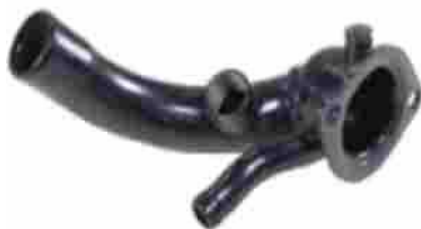
1242, TAPA BASE DE TERMOSTATO FORD SIERRA 2.3 CON BULBO, M.T.