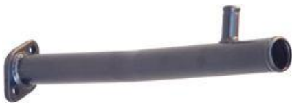
8319, CAÑO CIRCULACION AGUA FIAT 128 1.5-DUNA-REGATTA (CON AIRE), DINAHCOM