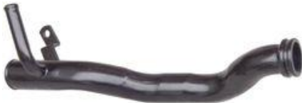
8360, CAÑO CIRCULACION AGUA FIAT DUNA-UNO 1.7 DIESEL NACIONAL (CON AIRE) 95/ADEL., DINAHCOM