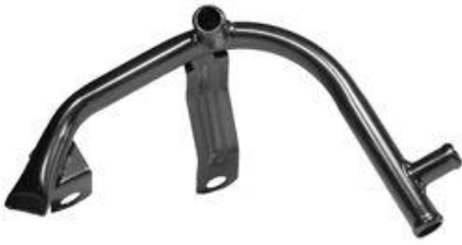
4164, CAÑO CIRCULACION AGUA VW SENDA DIESEL-GOL GTI 91/94, DINAHCOM