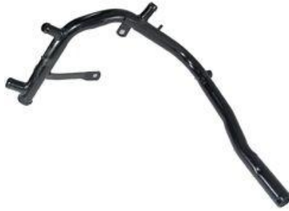
1032, CAÑO CIRCULACION AGUA VW TRANSPORTER 1.9 DIESEL 96/AD., DINAHCOM