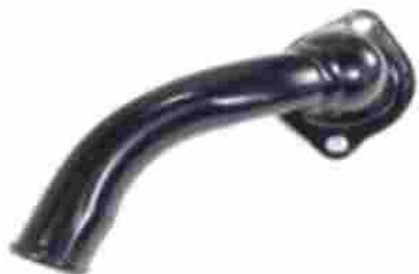
1240, TAPA BASE DE TERMOSTATO FORD TAUNUS '80 ADEL., M.T.