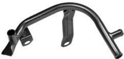
4150, CAÑO CIRCULACION AGUA VW GOL AB9 DIESEL 96/AD., DINAHCOM