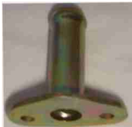
8322, CAÑO SALIDA CALEFACCION FIAT 147, DINAHCOM