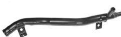
1324, CAÑO CIRCULACION AGUA FORD ESCORT MOTOR ZETEC 97/ADEL., DINAHCOM