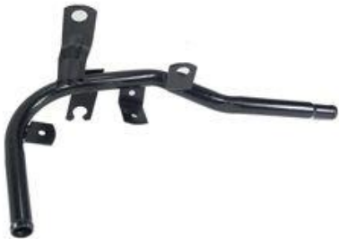
4153, CAÑO CIRCULACION AGUA VW GOL AB9 1.6-1.8 MOTOR CFI, DINAHCOM