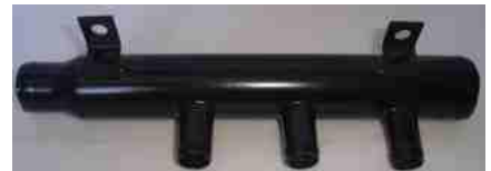
5004, CAÑO CIRCULACION AGUA CHEVROLET KADETT-MONZA 2.0 89/97, DINAHCOM