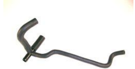
2017, CAÑO CIRCULACION AGUA SALIDA TAPA CILINDRO A BIDON RENAULT 19 DIESEL (SIN AIRE), DINAHCOM