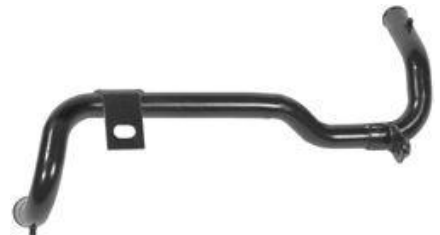
4003, CAÑO CIRCULACION AGUA PEUGEOT 306 1.8 16V., DINAHCOM