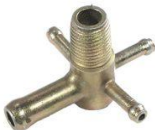
609, CAÑO AGUA MULTIPLE ADMISION FIAT REGATTA 2000, DINAHCOM