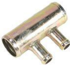
603, CONECTOR AGUA PEUGEOT 505 DSL, DINAHCOM