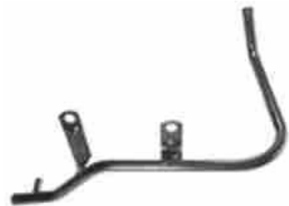
1319, CAÑO CIRCULACION AGUA FORD ESCORT 88/AD. MOTOR RENAULT, DINAHCOM