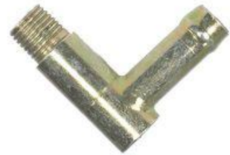
616, CONECTOR AGUA MULTIPLE ADMISION FIAT 147 A SERVO FRENO, DINAHCOM