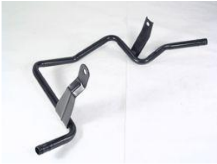
1048, CAÑO CIRCULACION AGUA FORD MONDEO DIESEL MOTOR ENDURA 93/97, DINAHCOM