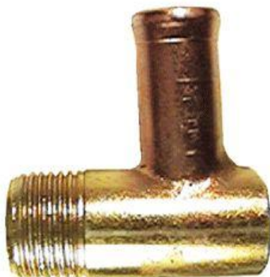
8301, CAÑO AGUA MULTIPLE ADMISION FIAT 128, DINAHCOM