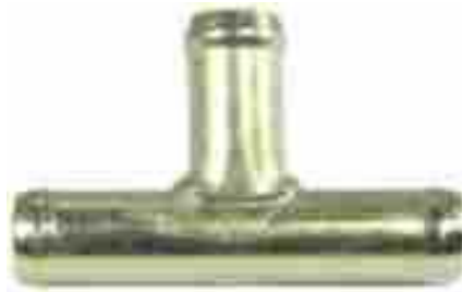
601, CONECTOR AGUA UNION 3 VIAS UNIVERSAL, DINAHCOM