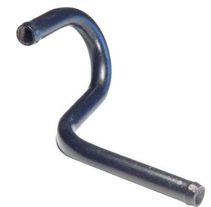
402, CAÑO CIRCULACION AGUA RENAULT 19 1.6, DINAHCOM