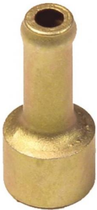
605, CONECTOR AGUA MULTIPLE ADMISION FORD MOTOR AUDI, DINAHCOM