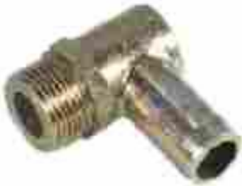
8340, CAÑO ENTRADA AGUA FIAT PALIO-SIENA, DINAHCOM