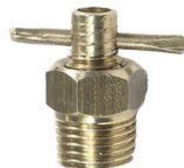
1315B, GRIFO PARA CAÑO CALEFACCION FORD SIERRA 2.3, DINAHCOM