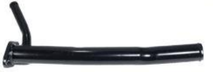
8365, CAÑO CIRCULACION AGUA FIAT UNO 1.6 TURBO INYECCION ITALIANO, DINAHCOM