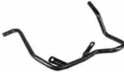
1051, CAÑO CIRCULACION AGUA FORD ESCORT-MONDEO TD 99/AD., DINAHCOM