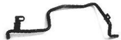
1064, CAÑO CIRCULACION AGUA FORD MONDEO DIESEL 95/98, DINAHCOM