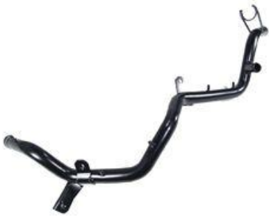
1037, CAÑO CIRCULACION AGUA VW GOLF 1.8 GL(CON AIRE Y DIRECCION), DINAHCOM