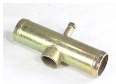
815, CONECTOR UNIVERSAL PARA MANGUERA CON ROSCA P/BULBO 22MM. Y CON PURGADOR, DINAHCOM