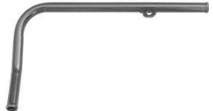
3132, CAÑO CIRCULACION AGUA RENAULT 18-21 2.0, DINAHCOM