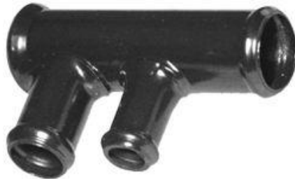
808, CAÑO CIRCULACION AGUA VW POLO-GOLF-CADDY 1.9 '96 AD., DINAHCOM