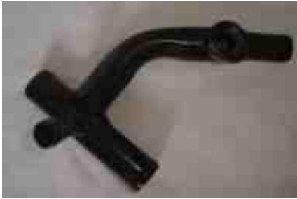
632, CONECTOR DE AGUA METALICO PARA CAÑO (2018), DINAHCOM