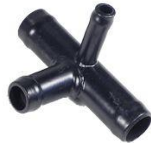
631, CONECTOR DE AGUA METALICO PARA CAÑO (2017), DINAHCOM