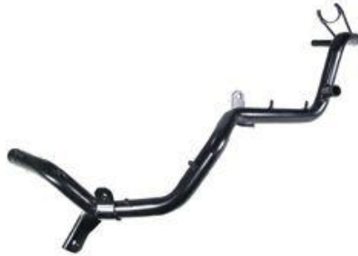
1033, CAÑO CIRCULACION AGUA VW GOLF 1.8 NAFTERO '95AD./SEAT IBIZA-CORDOBA GXL, DINAHCOM