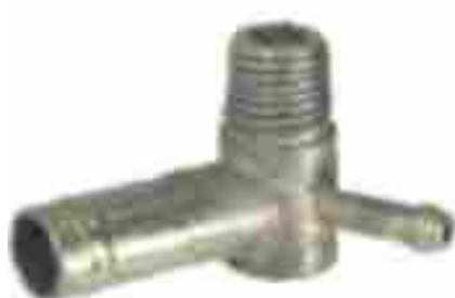
8338, CAÑO AGUA MULTIPLE ADMISION FIAT 128-DUNA-UNO 1.5 CON AIRE, DINAHCOM