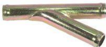
8334, CAÑO SALIDA RADIADOR FIAT REGATTA (Y), DINAHCOM