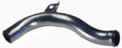
1328, CAÑO CIRCULACION AGUA RADIADOR FORD ESCORT 1.6 CON AIRE, DINAHCOM