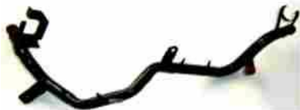
4159, CAÑO CIRCULACION AGUA VW POLO DIESEL (CON SOPORTE), DINAHCOM