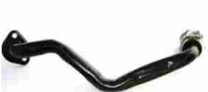
4301, CAÑO CIRCULACION AGUA DESCARGA GASES VW POLO DIESEL, DINAHCOM