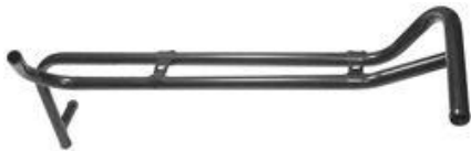
1003, CAÑO CIRCULACION AGUA FORD FALCON MOTOR 2.3 4 CILINDROS, DINAHCOM