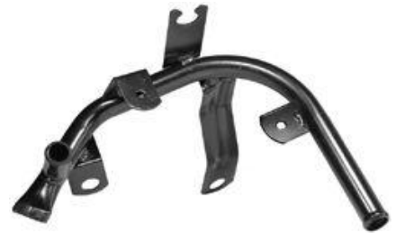
4169, CAÑO CIRCULACION AGUA VW GOL AB9 1.6-1.8 MI MULTIPUNTO, DINAHCOM