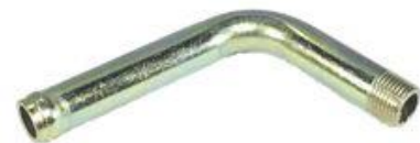
8350, CAÑO SALIDA CALEFACCION FIAT REGATTA 85, DINAHCOM