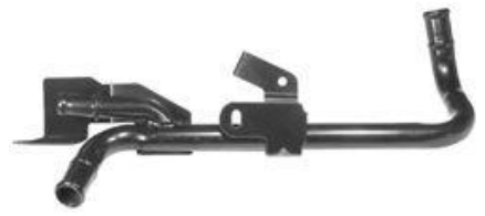
2008, CAÑO CIRCULACION AGUA RENAULT 19 1.8 INYECCION, DINAHCOM