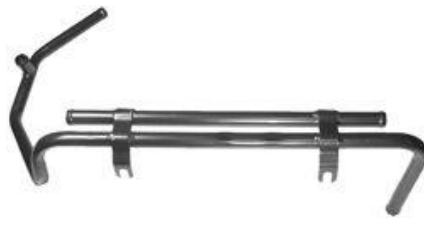
4161, CAÑO CIRCULACION AGUA VW GOL-SAVEIRO MOTOR RENAULT, DINAHCOM