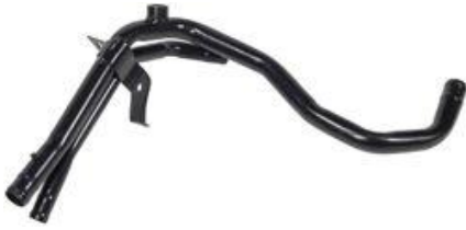
2025, CAÑO CIRCULACION AGUA RENAULT MEGANE 1.6, DINAHCOM