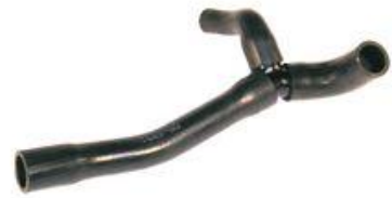
822, CAÑO BOMBA AGUA A TAPA CILINDRO VW POLO CLASSIC 1.7 SD (CONJUNTO), DINAHCOM