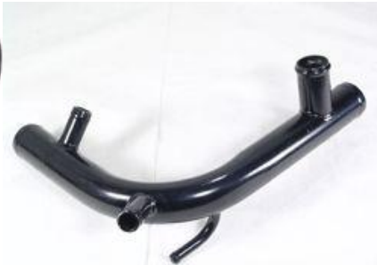
3031, CAÑO CIRCULACION AGUA FIAT PALIO-SIENA-PUNTO-IDEA 1.4 8v., DINAHCOM