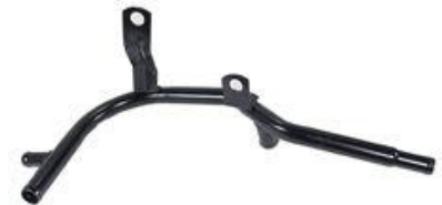
4167, CAÑO CIRCULACION AGUA FORD GALAXI 92/AD., DINAHCOM