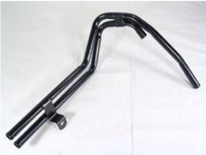
3134, CAÑO CIRCULACION AGUA RENAULT 18/1400 (SIN AIRE), DINAHCOM