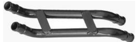
1042, CAÑO CIRCULACION AGUA FORD ESCORT-FIESTA-COURIER DIESEL 97/AD., DINAHCOM