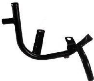
1058, CAÑO CIRCULACION AGUA VW QUANTUM 2.0 98/AD.(CON RADIADOR ACEITE), DINAHCOM