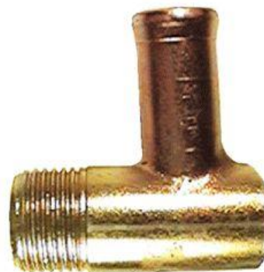
8336, CAÑO AGUA MULTIPLE ADMISION FIAT DUNA-UNO 1.6, DINAHCOM