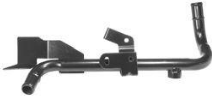
2014, CAÑO CIRCULACION AGUA RENAULT 19 RE DIESEL, DINAHCOM