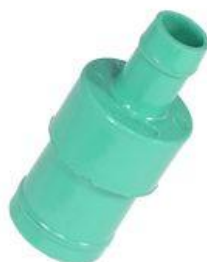
701, CONECTOR VALVULA DE GASES FORD TAUNUS, DINAHCOM