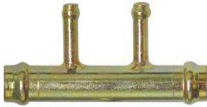
811, CONECTOR AGUA DOBLE, DINAHCOM