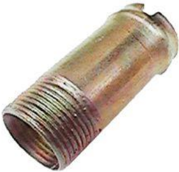
805, CONECTOR AGUA TAPA CILINDRO VW DODGE 1500, DINAHCOM