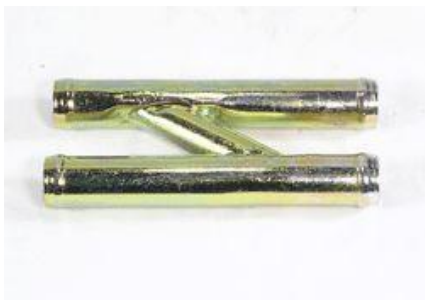
802, CAÑO CIRCULACION AGUA, DINAHCOM