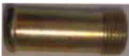
8323, CAÑO TAPA CILINDRO FIAT DUCATO 1.9 DIESEL, DINAHCOM