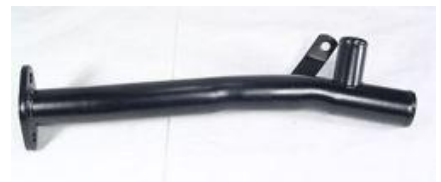
8318, CAÑO CIRCULACION AGUA FIAT 147 MOTOR 1050 CC.-UNO 1.5, DINAHCOM