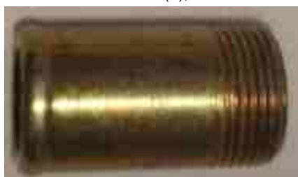
8324, CAÑO TAPA CILINDRO FIAT DUNA 1.7 DIESEL, DINAHCOM