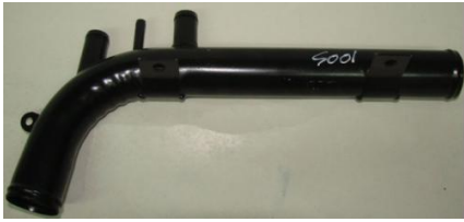
5001, CAÑO CIRCULACION AGUA CHEVROLET ZAFIRA 2.0 GLS 16V., DINAHCOM