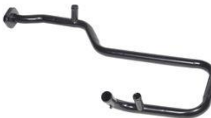
3025, CAÑO CIRCULACION AGUA FIAT DAILY 2.8 TURBO DIESEL, DINAHCOM