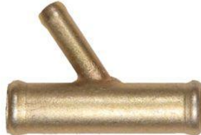
602, CONECTOR AGUA PEUGEOT 504 TIPO, DINAHCOM