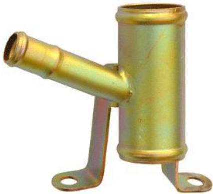
1044, CAÑO CIRCULACION AGUA FORD ESCORT-FIESTA-MONDEO 97/, DINAHCOM