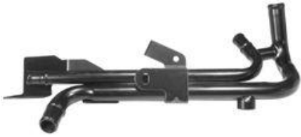
2019, CAÑO CIRCULACION AGUA RENAULT 19 CHAMADE, DINAHCOM