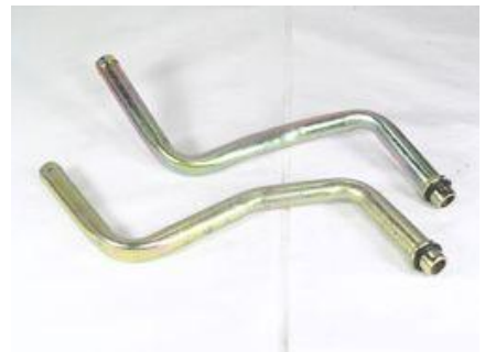
1057, CAÑO CIRCULACION AGUA VW GOL-SAVEIRO '00 CON TRABA (CONJUNTO RADIADOR), DINAHCOM