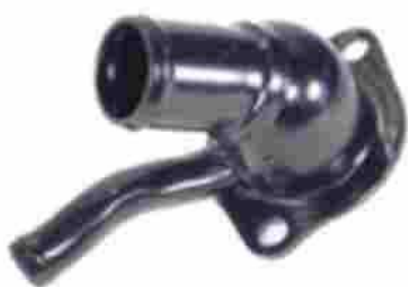
1243, TAPA BASE DE TERMOSTATO FORD FALCON 2.3, M.T.

Contamos con una Importante Infraestructura Para Satisfacer sus Necesidades en Forma Rápida y Efectiva, por eso Nuestro Objetivo Principal es que Usted y su Empresa se Contacten Con Nosotros a la Brevedad.