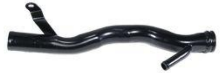
8375, CAÑO CIRCULACION AGUA FIAT DUNA-FIORUNO 1.7 DIESEL, DINAHCOM