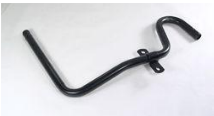
1062, CAÑO CIRCULACION AGUA VW GOL-SAVEIRO 1.8-2.0 '99 AD.(CON AIRE), DINAHCOM