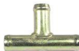
825, CONECTOR PARA AGUA UNION 3 VIAS, DINAHCOM