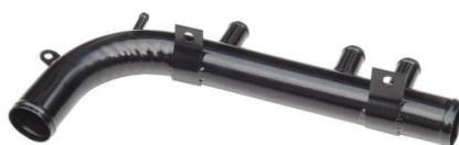
5002, CAÑO CIRCULACION AGUA CHEVROLET VECTRA 2.0 MPFI 16V. 97/ADEL., DINAHCOM