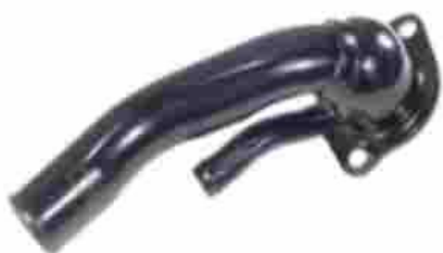
1241, TAPA BASE DE TERMOSTATO FORD TAUNUS 2.3 CON AIRE, M.T.