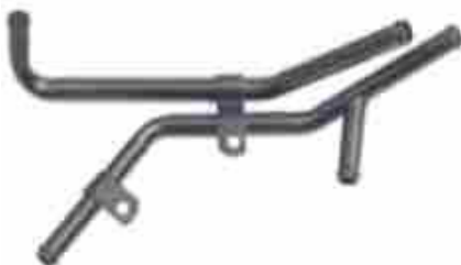
1049, CAÑO CIRCULACION AGUA CHEVROLET S10/BLAZER '96 MOTOR MAXISON, DINAHCOM