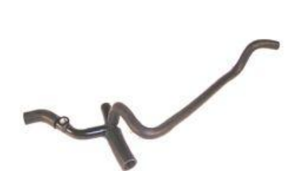
2018, CAÑO CIRCULACION AGUA RENAULT 19 1.7 NAFTERO (BOMBA CON BULBO), DINAHCOM