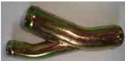
734, CONECTOR AGUA VENTEO PEUGEOT 306-405, DINAHCOM