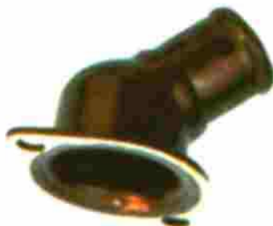
1244, TAPA BASE DE TERMOSTATO FORD TAUNUS 74/76, M.T.