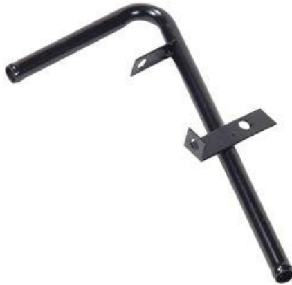
1059, CAÑO CIRCULACION AGUA DESCARGA GASES FORD F100 2.5 MAXION, DINAHCOM