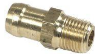
626, CAÑO PARA BOMBA AGUA RENAULT 12 (GRANDE), DINAHCOM