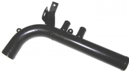
5005, CAÑO CIRCULACION AGUA CHEVROLET CORSA 8V., DINAHCOM