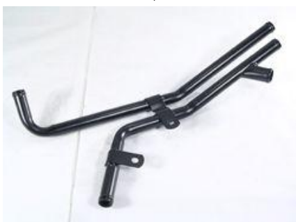
1052, CAÑO CIRCULACION AGUA MERCEDES BENZ SPRINTER 310 99/AD., DINAHCOM