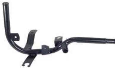
4160, CAÑO CIRCULACION AGUA VW GOL AB9 1.6-1.8 '96 (CON AIRE), DINAHCOM