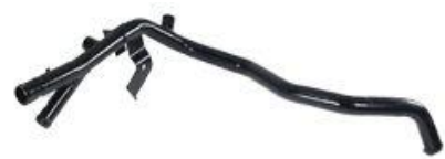
2022, CAÑO CIRCULACION AGUA RENAULT 19-CLIO 1.8-1.9 DIESEL (SIMPLE), DINAHCOM