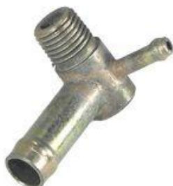
8337, CAÑO AGUA MULTIPLE ADMISION FIAT DUNA-UNO 1.4 C/AIRE, DINAHCOM