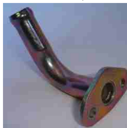
8306, CAÑO ANTECUERPO B/AGUA FIAT 128, DINAHCOM