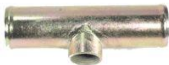
816, CONECTOR UNIVERSAL PARA MANGUERA CON ROSCA P/BULBO 22MM. Y SIN PURGADOR, DINAHCOM