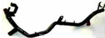
4156, CAÑO CIRCULACION AGUA FORD ORION 2.0-XR3 CABRIOLET, DINAHCOM