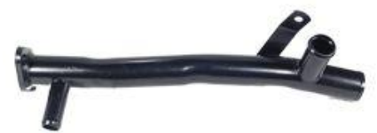
8317, CAÑO CIRCULACION AGUA FIAT 147 MOTOR 133, DINAHCOM