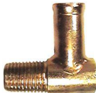
8364, CAÑO AGUA MULTIPLE ADMISION FIAT DUNA SC-PALIO 1.6 NAFTERO, DINAHCOM