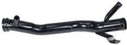
8376, CAÑO CIRCULACION AGUA FIAT DUCATO 1.9 TURBO DIESEL, DINAHCOM