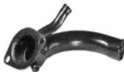
1245, TAPA BASE DE TERMOSTATO FORD SIERRA 2.3 SIN BULBO, M.T.