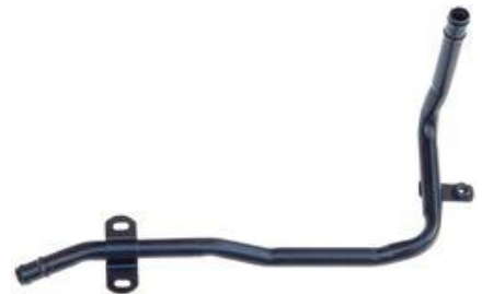
4172, CAÑO CIRCULACION AGUA VW GOL AB9 1.9 DIESEL SIN A/A-SAVEIRO '99, DINAHCOM