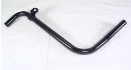
3130, CAÑO CIRCULACION AGUA RENAULT TRAFIC 2.0-2.2, DINAHCOM