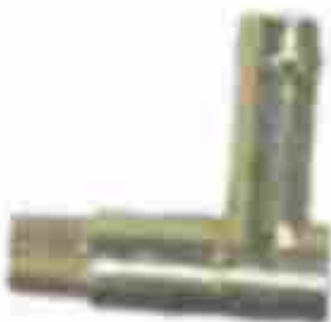
8363, CAÑO AGUA MULTIPLE ADMISION FIAT SPAZIO A SERVO, DINAHCOM