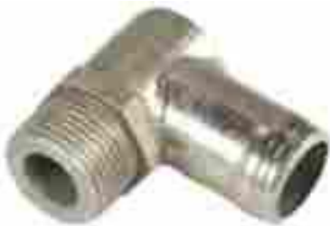
8342, CAÑO SALIDA AGUA FIAT PALIO-SIENA, DINAHCOM