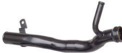
8361, CAÑO CIRCULACION AGUA FIAT DUNA-UNO 1.7 DIESEL NACIONAL (SIN AIRE) 91/95, DINAHCOM