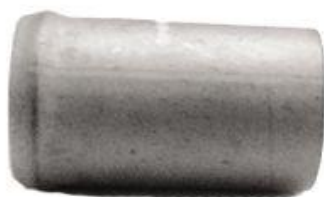
634, CONECTOR PARA BOMBA AGUA CHEVROLET CORSA-ASTRA-VECTRA, DINAHCOM