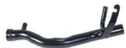
8362, CAÑO CIRCULACION AGUA FIAT DUCATO 1.9 DIESEL (MODELO VIEJO), DINAHCOM