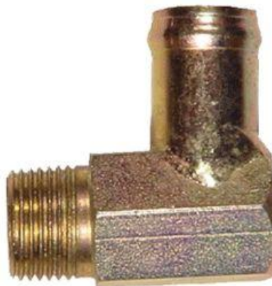
716, CONECTOR DE AGUA FORD ESCORT '97 AD.-FIESTA MONDEO '94 AD., DINAHCOM