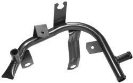
4152, CAÑO CIRCULACION AGUA VW GOL 2.0 GTI '96 AD.(CON RADIADOR DE ACEITE), DINAHCOM