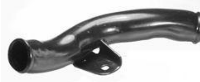
1327, CAÑO CIRCULACION AGUA RADIADOR FORD ESCORT 1.6 SIN AIRE, DINAHCOM