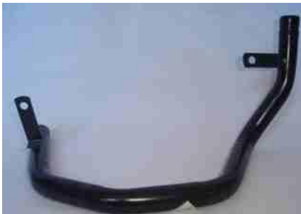
903, CAÑO CIRCULACION AGUA FORD KA 1.0-1.6 ROCAM, DINAHCOM