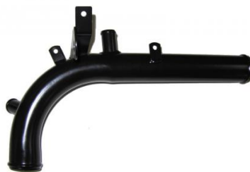
5006, CAÑO CIRCULACION AGUA CHEVROLET CORSA II-ASTRA-MERIVA 1.6 16V., DINAHCOM