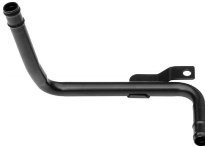
1066, CAÑO CIRCULACION AGUA FORD MONDEO, DINAHCOM