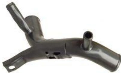
1046, CAÑO CIRCULACION AGUA FORD ESCORT 1.8 TD 97/AD., DINAHCOM