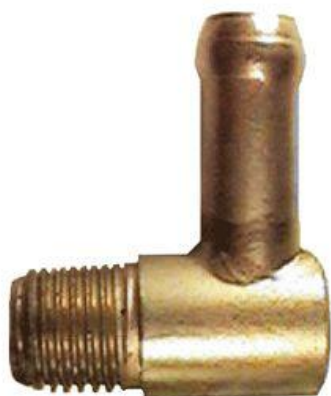
8307, CAÑO AGUA MULTIPLE ADMISION FIAT 128-147, DINAHCOM