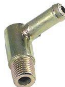
8339, CAÑO AGUA MULTIPLE ADMISION FIAT 128 1.5 SIN AIRE, DINAHCOM