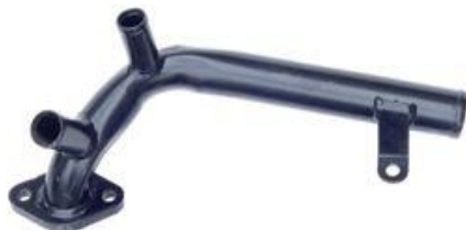
1029, CAÑO CIRCULACION AGUA FORD TRANSIT 96/AD., DINAHCOM