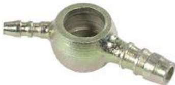
717, CONECTOR BOMBA INYEC.CON RETORNO VW SENDA-GOL-SAVARIO 1.6 DIESEL, DINAHCOM