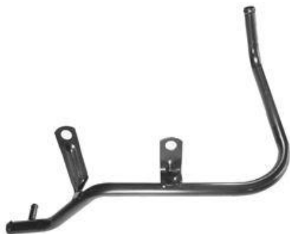
1319A, CAÑO CIRCULACION AGUA FORD ESCORT 90-93 CON DERIVACION, DINAHCOM