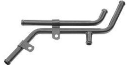
1321, CAÑO CIRCULACION AGUA FORD RANGER 2.5 MAXION 96/AD., DINAHCOM