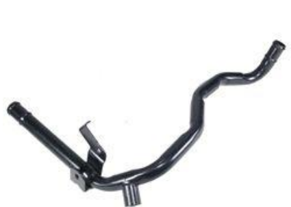
2026, CAÑO CIRCULACION AGUA RENAULT CLIO '98 AD., DINAHCOM