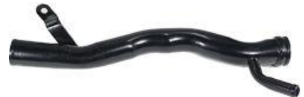
3019, CAÑO CIRCULACION AGUA FIAT DUNA-UNO 1.7 DIESEL IMPORTADO HAS/94, DINAHCOM