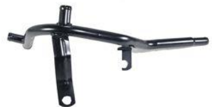
4162, CAÑO CIRCULACION AGUA VW SAVEIRO-GOL-SENDA '91/GOL-SENDA 1.8 93 MOTOR AUDI, DINAHCOM