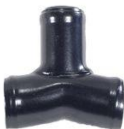
847, CONECTOR, DINAHCOM