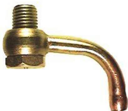
715, RECUPERADOR DE AGUA FORD ESCORT-FIESTA DSL, DINAHCOM