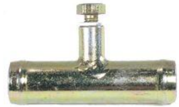
8331, CONECTOR AGUA UNION 3 VIAS UNIVERSAL (CON PURGADOR), DINAHCOM