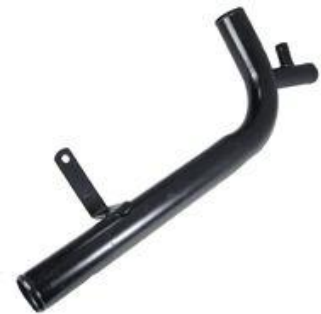
1050, CAÑO CIRCULACION AGUA FORD F14000 MWM 93/AD., DINAHCOM