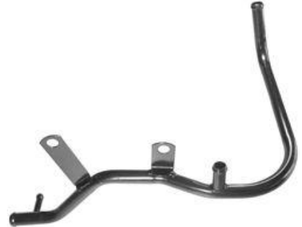
1322, CAÑO CIRCULACION AGUA FORD ESCORT 1.8 CAJA MQ CON DERIVACION, DINAHCOM