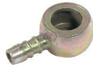
718, CONECTOR BOMBA INYEC.A FILTRO GASOIL VW 1.6-1.9, DINAHCOM