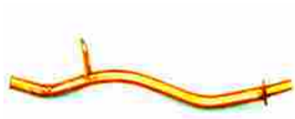
8351, TUBO PARA VARILLA DE ACEITE FIAT REGATTA 2.0, DINAHCOM