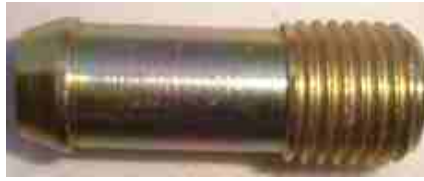
8344, CAÑO ANTECUERPO B/AGUA FIAT PALIO-SIENA, DINAHCOM