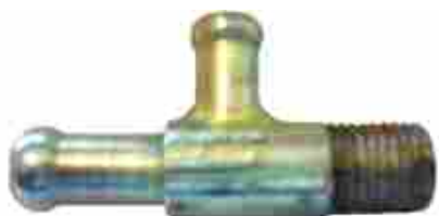
8355, CAÑO SALIDA CALEFACCION FIAT TEMPRA, DINAHCOM