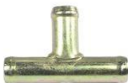
820, CONECTOR PARA AGUA UNION 3 VIAS, DINAHCOM