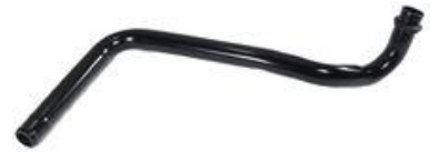
1063, CAÑO CIRCULACION AGUA DESCARGA GASES VW GOLF-PASSAT 2.0 95/98, DINAHCOM