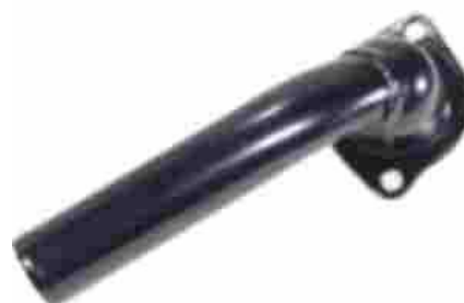
1239, TAPA BASE DE TERMOSTATO FORD TAUNUS 77/80, M.T.