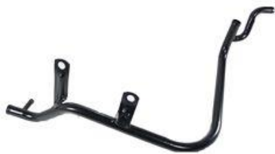
4168, CAÑO CIRCULACION AGUA FORD ESCORT 1.8 NAFTERO, DINAHCOM