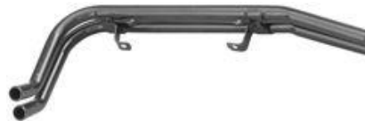
3133, CAÑO CIRCULACION AGUA RENAULT 18/1400-1600 (CON AIRE), DINAHCOM